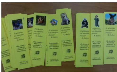
5.att. Grāmatzīme topošajiem pirmklasniekiem (Autors: I. Lāce, 2016)

12) Topošajiem 1. klašu skolēniem (2016./2017.m.g.) bija iepazīšanās ar skolas bibliotēku – uzzināja par grāmatu daudzveidību bibliotēkā, minēja mīklas, meklēja sava vārda burtiņu un līmēja to pie grāmatu varoņu attēliem (plakāti), saņēma grāmatzīmi (skatīt 5. attēlu), tika runāts par draudzību.