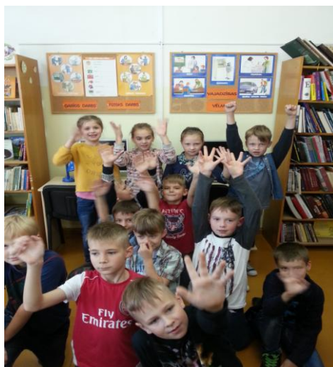
4.att. 2.b klases izglītojamie

11) Bibliotēka ir vieta, kur smelties zināšanas un lietderīgi pavadīt laiku, bet karjeras nedēļas noskaņās sākumskolas skolēni bibliotēkā varēja vērt vaļā savu „Informācijas atslēgu KARJERAS DURVĪM”, vērot izstādi un uzzināt informāciju par dažādām profesijām - kādi profesiju pārstāvji vairāk veic fizisku darbu, kādi garīgu un kādas intereses, spējas, talanti, prasmes, zināšanas ir nepieciešamas šo profesiju pārstāvjiem. Skolēni uzzināja, kas ir CV (dzīves gājums) un kādi ir tā aizpildīšanas nosacījumi (skatīt 4. attēlu).