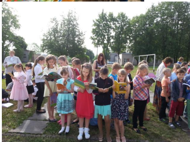
8., 9. att. Zibakcija Rēzeknes sākumskolā (Autors: I. Lāce, 2016)

5) Bibliotēkā tika vadīts Rēzeknes sākumskolā Interesu izglītības pulciņš “Izzinošais klubiņš „Grāmatu pasaulē””. Pulciņā valdīja draudzīga atmosfēra un saprašanās. Audzināta izglītojamo mīlestība pret lasīšanu un literatūru (skatīt 10., 11., 12., 13. attēlu), īstenojot izglītojamo lasīšanas veicināšanu, veidota izpratne par Latvijas kultūrvidi un tradīcijām, radīta labvēlīga vide, veidojot uzvedības, savstarpējās saskarsmes un komandas darba iemaņas un prasmes. Tika piedāvāta atbilstoša literatūra, ieinteresēti skolēni lasīt un darboties, piedāvātas viņiem daudzveidīgas, interaktīvas darbošanās, tika dota iespēja pulciņā izmantot arī modernās tehnoloģijas, iepazīstināti skolēni ar grāmatu uzbūves pamatelementiem un iemācīti atrast nepieciešamo informāciju bibliotēkā.