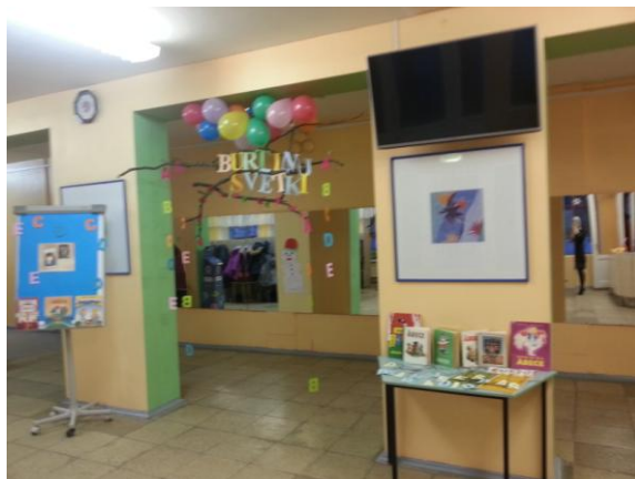
6., 7. att. Skolas pasākums “Burtiņu svētki” (Autors: I. Lāce, 2016)

14) Rēzeknes sākumskolā pēdējā skolas dienā – 30. maijā vienuviet, pulcējoties 1. – 6. klašu skolēniem un skolotājiem (sadarbībā ar vecākiem), norisināsies zibakcija „Lasīsim visi kopā un dāvināsim grāmatīņu savas skolas bibliotēkai!” (skatīt 8., 9. attēlu). Zibakcijā visi dalījās lasīt priekā ar klases biedriem, skolas biedriem, skolotājiem un akcijas noslēgumā uzdāvināja līdzpaņemto grāmatīņu Rēzeknes sākumskolas bibliotēkai.