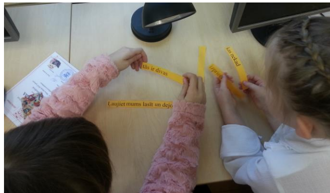
2., 3., 4. att. Pasākums čaklākajiem “Bērnu žūrija 2016” lasītājiem/ekspertiem

11) Karjeras nedēļas 2016 ietvaros informatīvā akcija bija „Informācijas kompass tavas karjeras ceļam” (Rēzeknes pilsētas vispārizglītojošo un profesionālo izglītības iestāžu bibliotēkas). Rēzeknes sākumskolas skolēni bibliotēkā varēja apskatīt informācijas kompasu, vērot izstādi un uzzināt informāciju par dažādām profesijām, piedalīties aktivitātēs, atbildēt uz jautājumiem, strādāt grupās (skatīt 5., 6., 7., 8. attēlu).