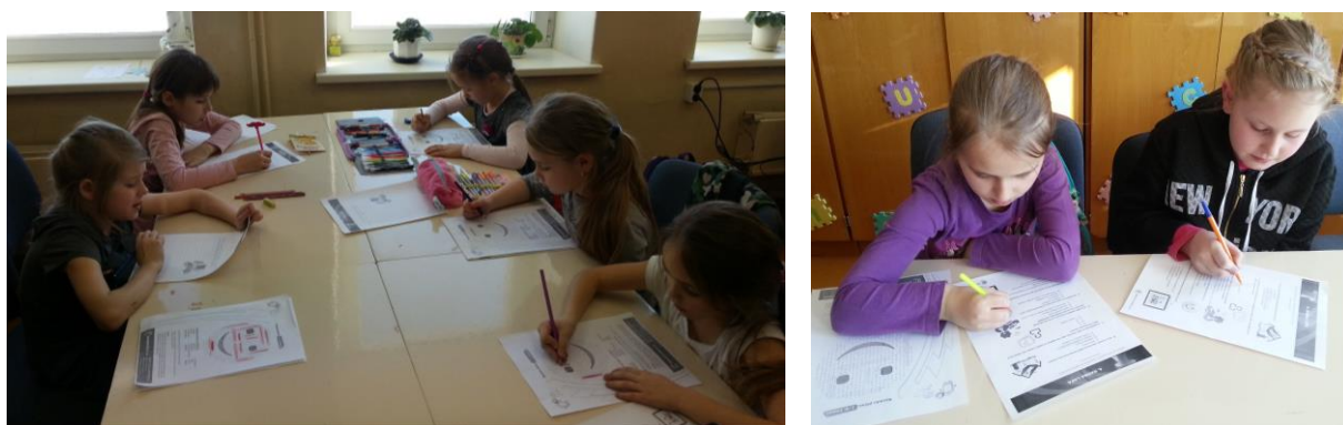
12., 13. att. Vispasaules Drošāka interneta diena (Autors: I. Lāce, 2017)

13) Bibliotēkā atbalstīta Vispasaules Drošāka interneta diena (sauklis “Kopā par labāku internetu!”). Veiktas aktivitātes bibliotēkas apmeklētājiem par drošību internetā - aicināts būt uzmanīgiem interneta lietotājiem, organizētas un vadītas nodarbības (izmantoti – Net-Safe Latvia Drošāka interneta centra sagatavotie mācību materiāli) (skatīt 12., 13. attēlu).