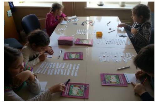
24., 25., 26. att. “Izzinošais klubiņš “Grāmatu pasaulē””