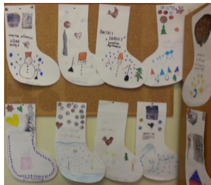
22., 23. att. “Izzinošais klubiņš “Grāmatu pasaulē”” (Autors: I. Lāce, 2016)