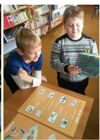
5., 6., 7., 8. att. 1.b klases un 2.a klases izglītojamie

12) Notika Ziemeļvalstu Bibliotēku nedēļas 2016 rīta stundas lasījumi Rēzeknes sākumskolas bibliotēkā kopā ar 5.m klases skolēniem (skatīt 9., 10.,11. attēlu). 14. novembrī, lielā lasīšanas dienā, Rēzeknes sākumskolas bibliotēkā viesojās un 5.m klases skolēnus ar Norvēģijas