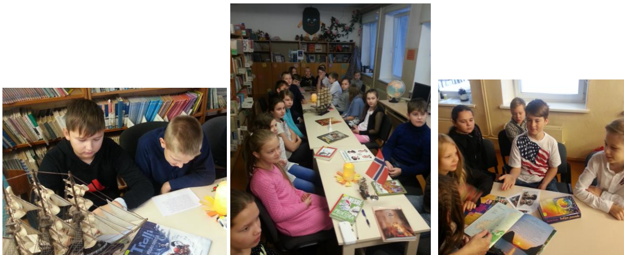
9., 10., 11. att. Ziemeļvalstu Bibliotēku nedēļas 2016 rīta stundas lasījumi Rēzeknes sākumskolas bibliotēkā kopā ar 5.m klases skolēniem