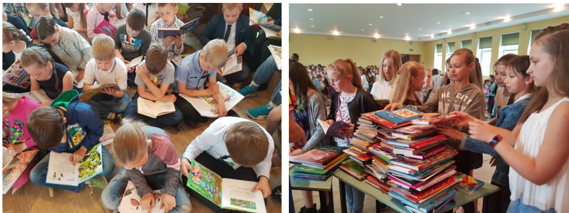
20., 21. att. Zibakcija Rēzeknes sākumskolā

dāvināsim grāmatiņu savas skolas bibliotēkai!” (skatīt 20., 21. attēlu). Zibakcijā visi dalījās lasītpriekā ar klases biedriem, skolas biedriem, skolotājiem un akcijas noslēgumā uzdāvināja līdzpaņemto grāmatiņu Rēzeknes sākumskolas bibliotēkai. Bērnu rakstniece Astrida Lindgrēne savulaik par grāmatu teikusi: "Grāmatai vajadzīga bērna fantāzija, tas nu reiz tā ir. Bet vēl jo vairāk bērna fantāzijai ir vajadzīga grāmata, kas palīdzētu dzīvot un augt. Grāmata ir neaizstājama, tā spārno fantāziju."