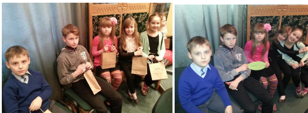
14., 15., 16., 17. att. Rēzeknes sākumskolas skolēni Rēzeknes pilsētas bērnu bibliotēkā

15) Rēzeknes sākumskolā atbalstīta Latvijas valsts simtgades svinību ietvaros „Patriotisma stunda 4.- 6. klašu skolēniem”- veidota izstāde “Mana Latvija”, atbalstīta zibakcija Rēzeknes sākumskolā „Lasīsim visi kopā un dāvināsim grāmatiņu savas skolas bibliotēkai.” Atbalstīts pasākums “Vecmāmiņ, kā tur ir? Tu māmiņai māmiņa esi...” viktorīna „Astridas Lindgrēnes varoņu pasaulē” (piedāvāti bibliotekārie pakalpojumi u.c.) un citas aktivitātes (skatīt 18. un 19. attēlu).